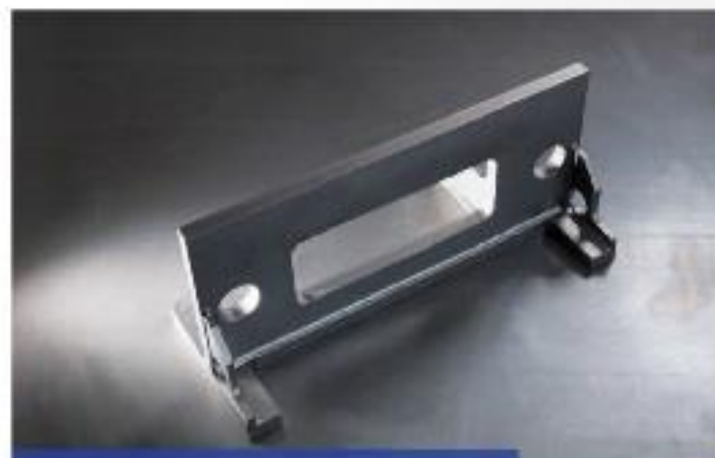
Vom Einzelteil zum fertigen Schweißkörper.