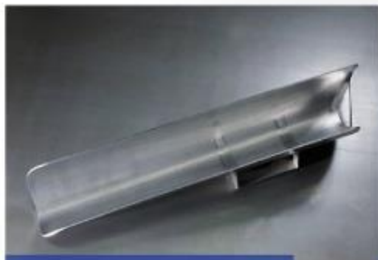
Präzises Konstruktionsbauteil aus Edelstahl.