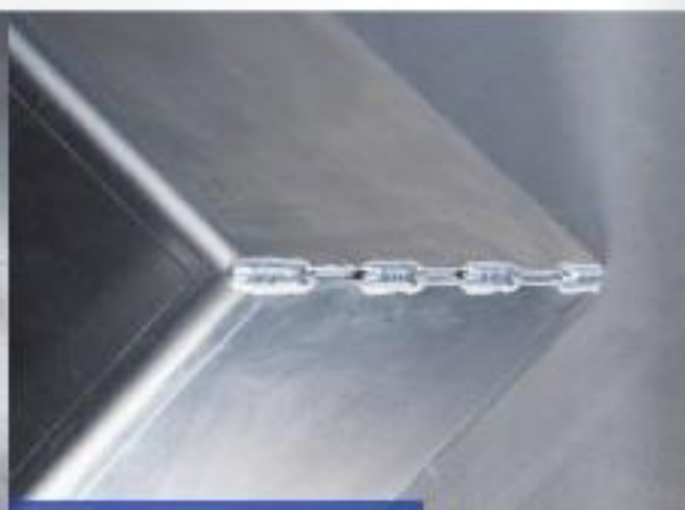
Das Schweißen und die Verarbeitung von Aluminium.

Lasern, Brennschneiden, Sägen, Scheren, Abkanten, Stanzen, Schweißen, Strahlen, Lackieren, Beschichten, Baugruppenmontage.