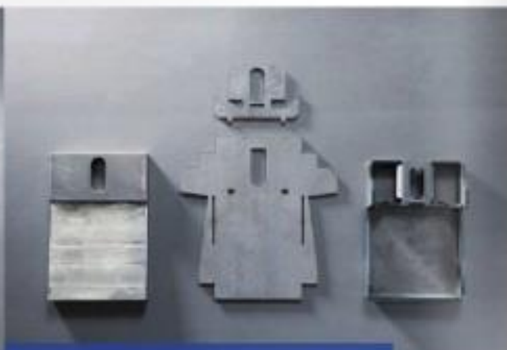
Neukonstruktion zur kostengünstigeren Variante.

Qualifikation, Erfahrung, Kreativität und moderne Technologie, das sind die Komponenten zur Fertigung individueller Lösungen auf der Basis der Stahl, Edelstahl und Aluminiumverarbeitung. Sie haben eine Idee? Wir setzen diese konstruktiv und fertigungstechnisch um.